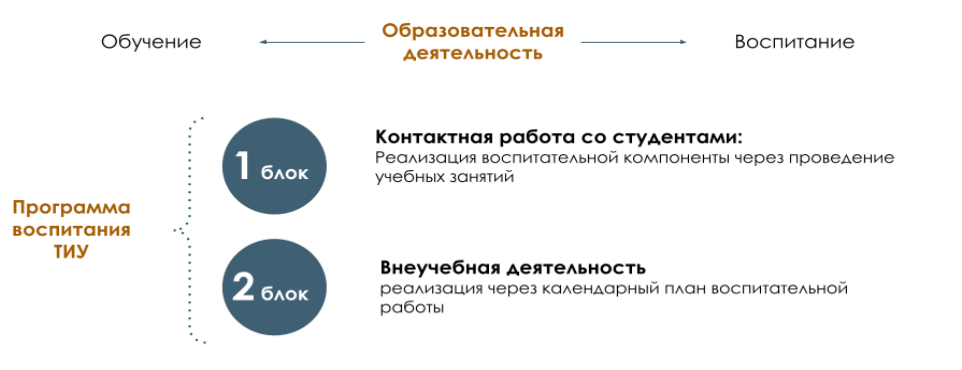
Рис. 1 Встраивание в образовательное пространство воспитательной компоненты