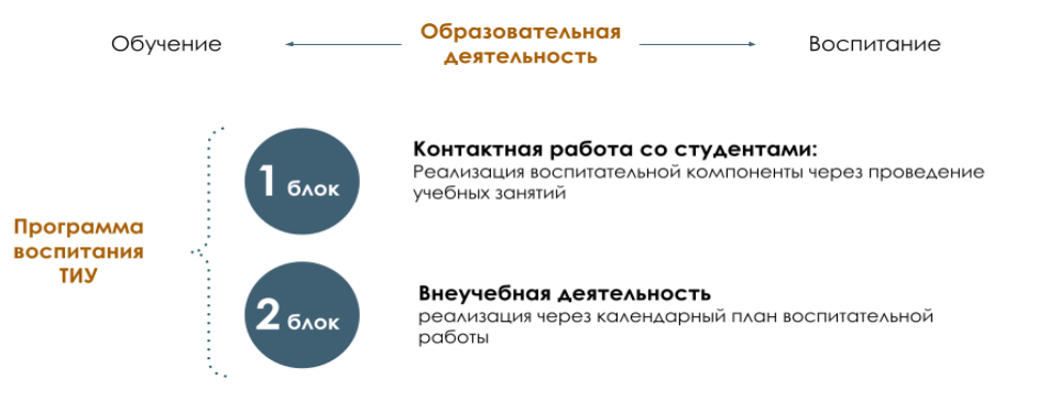
Рис. 1 Встраивание в образовательное пространство воспитательной компоненты