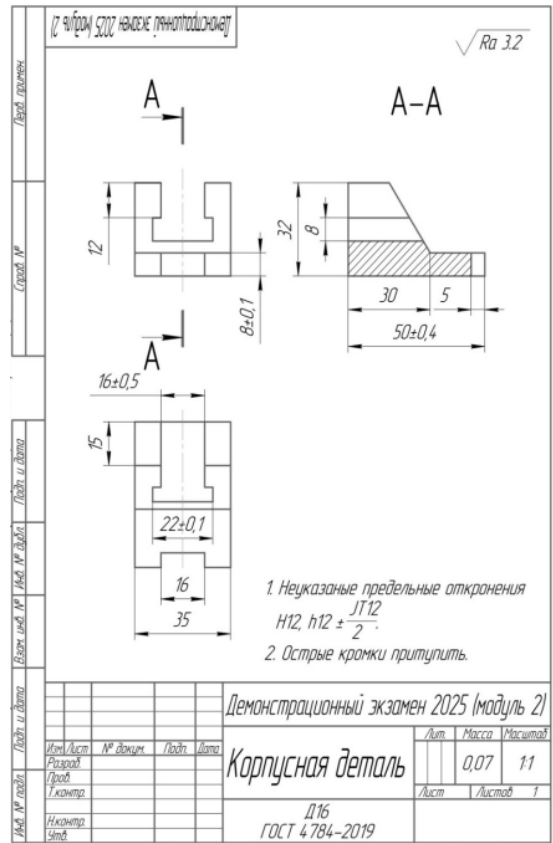
Чертеж к Модулю 2