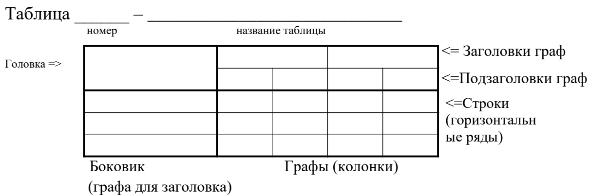
Рисунок 6.1 –Внешний вид таблицы

Если повторяющийся в разных строках графы таблицы текст состоит из одного слова, то его после первого написания допускается заменять кавычками; если из двух и более слов, то при первом повторении его заменяют словами «То же», а далее – кавычками. Ставить кавычки вместо повторяющихся цифр, марок, знаков, математических и химических символов не допускается. Если цифровые или иные данные в какой-либо строке таблицы не приводят, то в ней ставят прочерк.