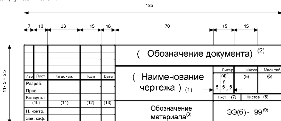
Рисунок 3.1 - Основная надпись (штамп)

В графах основной надписи (номера граф на рис.2.1 показаны в скобках) указывают: