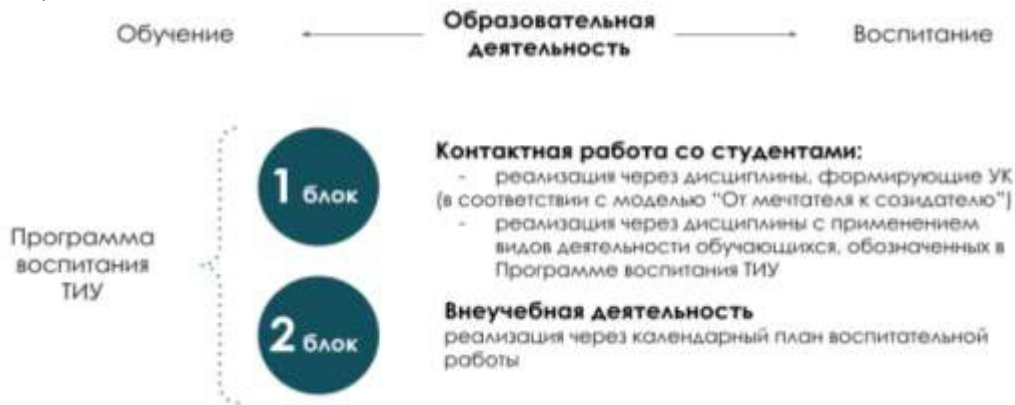
Рис. 1 Воспитательная компонента в образовательном пространстве

Воспитательная компонента встраивается в образовательное пространство ТИУ в соответствии с компетентностной моделью «От Мечтателя к Созидателю» (в соответствии с Программой воспитания ТИУ «Созидатель – мой образ жизни») через два блока (рисунок 1):