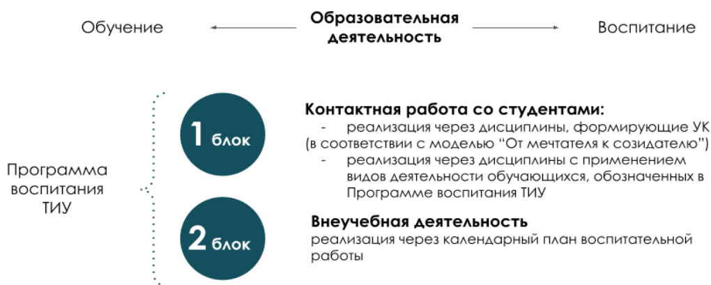
Рис. 1 Воспитательная компонента в образовательном пространстве

Воспитательная компонента встраивается в образовательное пространство ТИУ в соответствии с компетентностной моделью «От Мечтателя к Созидателю» (в соответствии с Программой воспитания ТИУ «Созидатель – мой образ жизни») через два блока (рисунок 1):