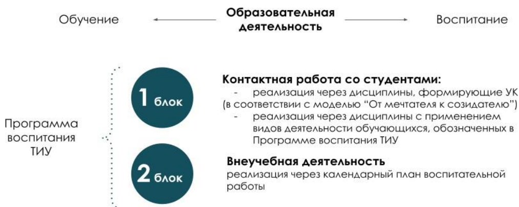
Рис. 1 Воспитательная компонента в образовательном пространстве

Воспитательная компонента встраивается в образовательное пространство ТИУ в соответствии с компетентностной моделью «От Мечтателя к Созидателю» (в соответствии с Программой воспитания ТИУ «Созидатель – мой образ жизни») через два блока (рисунок 1):