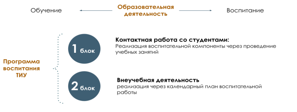
Рис. 1 Встраивание в образовательное пространство воспитательной компоненты