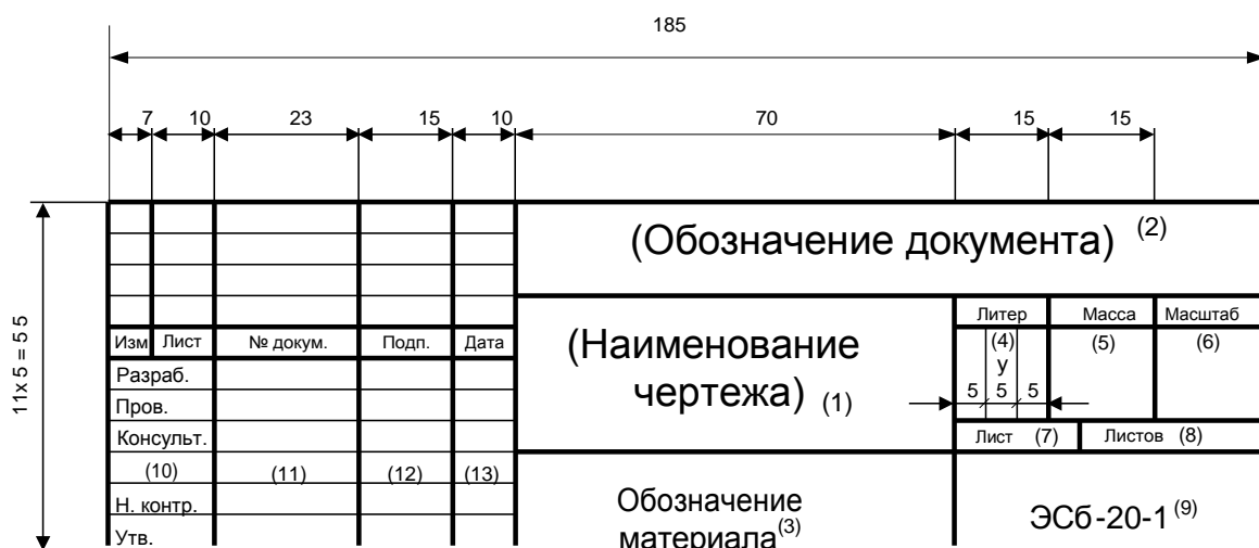
Рис. 3.1. Основная надпись (штамп)