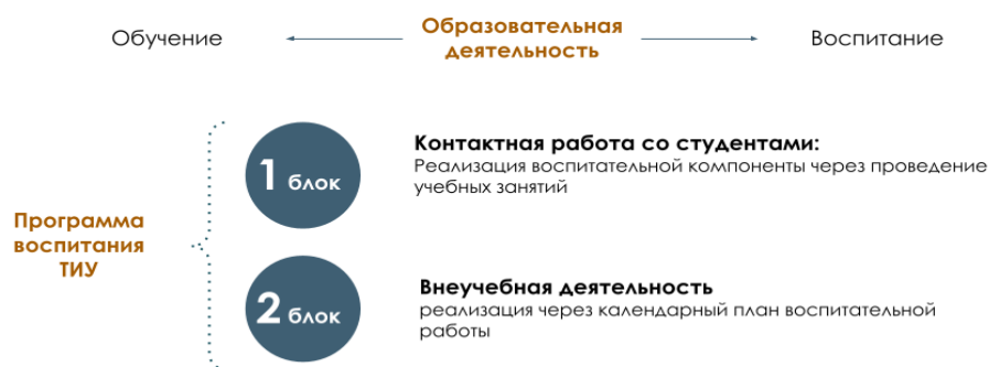
Рис. 1 Встраивание в образовательное пространство воспитательной компоненты