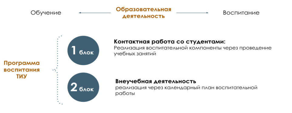
Рис. 1 Встраивание в образовательное пространство воспитательной компоненты