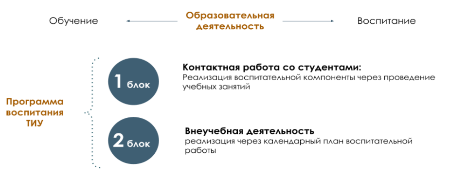
Рис. 1 Встраивание в образовательное пространство воспитательной компоненты