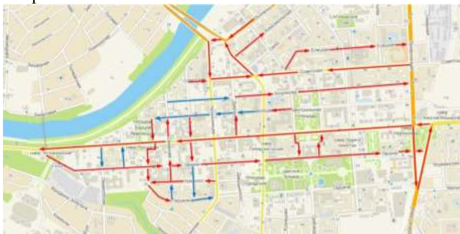
Рисунок 1 – Схема одностороннего движения по улице Республики города Тюмени

Иллюстрация и наименование иллюстрации не должны находиться на разных страницах.