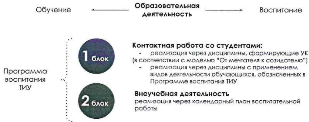
Рис. 1 Воспитательная компонента в образовательном пространстве

Воспитательная компонента встраивается в образовательное пространство ТИУ в соответствии с компетентностной моделью «От Мечтателя к Созидателю» (в соответствии с Программой воспитания ТИУ «Созидатель – мой образ жизни») через два блока (рисунок 1):