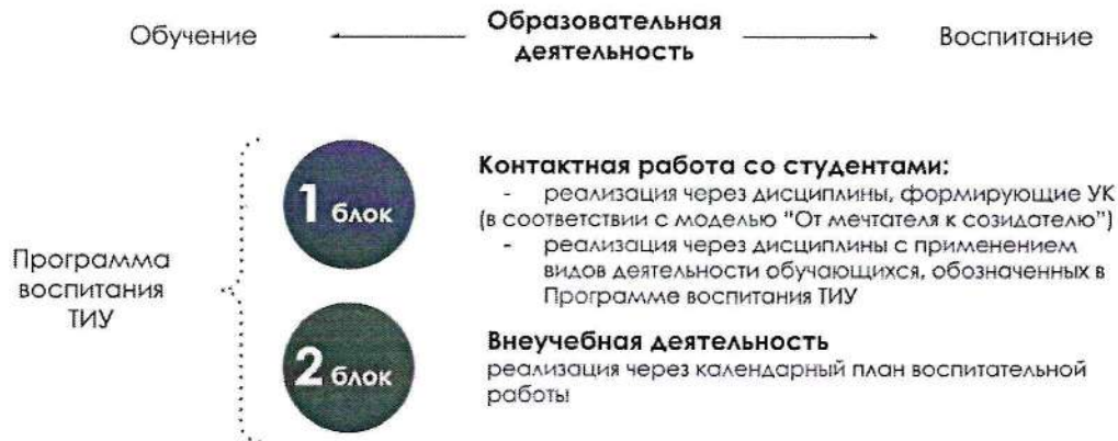
Рис. 1 Воспитательная компонента в образовательном пространстве

Воспитательная компонента встраивается в образовательное пространство ТИУ в соответствии с компетентностной моделью «От Мечтателя к Созидателю» (в соответствии с Программой воспитания ТИУ «Созидатель – мой образ жизни») через два блока (рисунок 1):