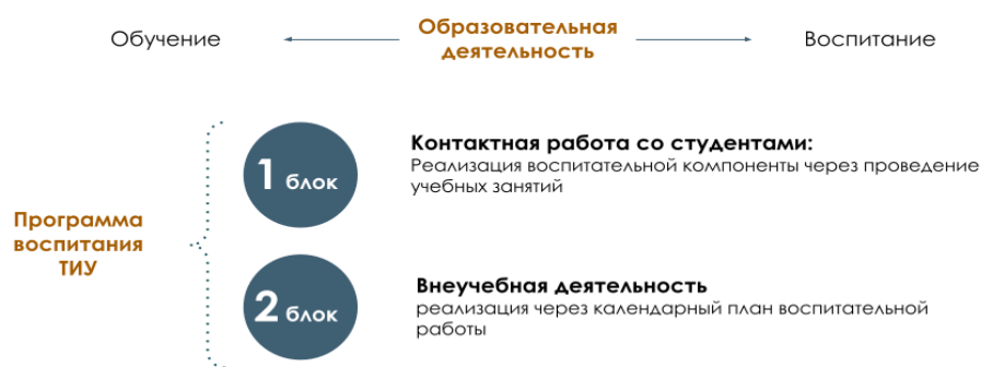
Рис. 1 Встраивание в образовательное пространство воспитательной компоненты