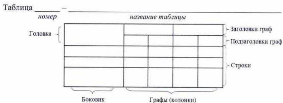
Рисунок 8 — Пример оформления таблицы

Пример оформления таблицы приведен на Рисунке 8.