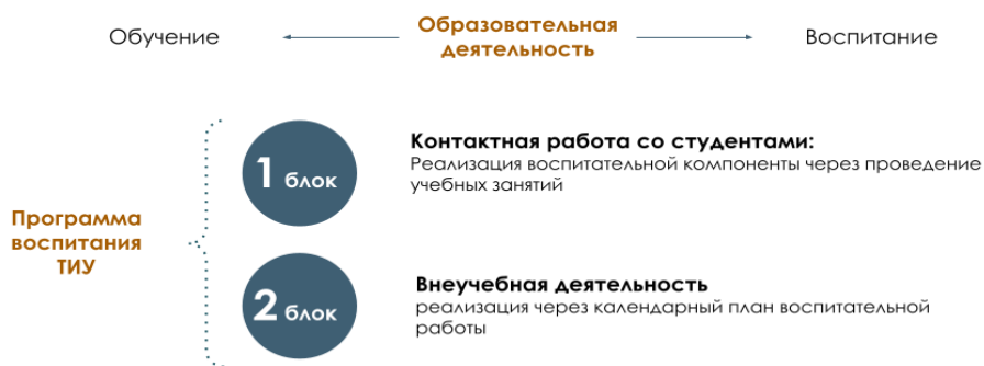
Рис. 1 Встраивание в образовательное пространство воспитательной компоненты