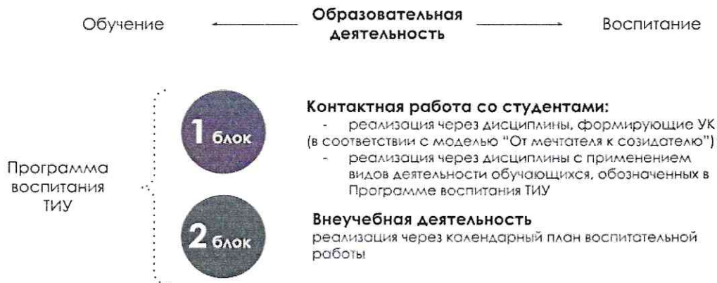
Рис. 1 Воспитательная компонента в образовательном пространстве

Воспитательная компонента встраивается в образовательное пространство ТИУ в соответствии с компетентностной моделью «От Мечтателя к Созидателю» (в соответствии с Программой воспитания ТИУ «Созидатель – мой образ жизни») через два блока (рисунок 1):