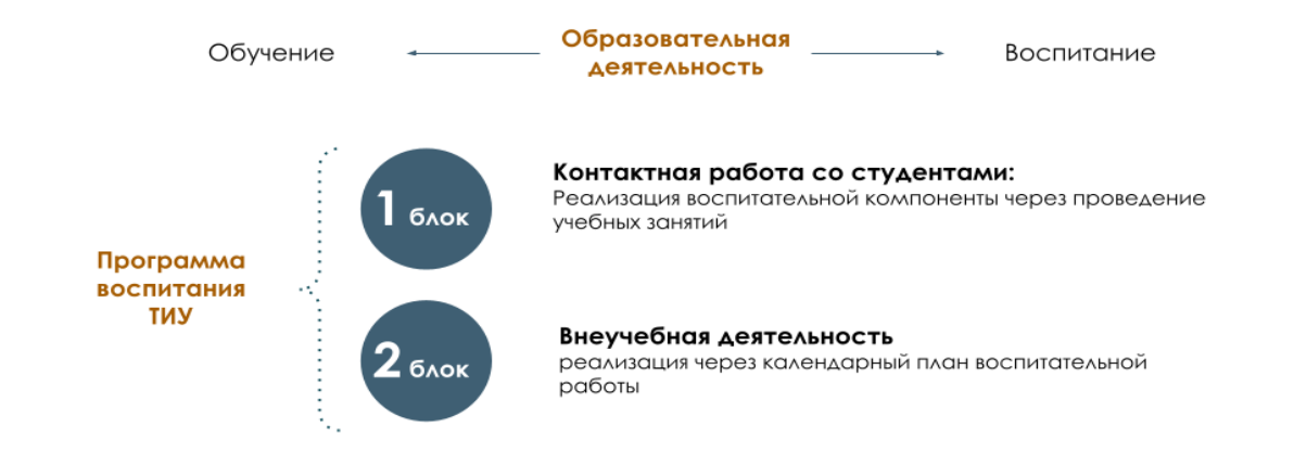
Рис. 1 Встраивание в образовательное пространство воспитательной компоненты