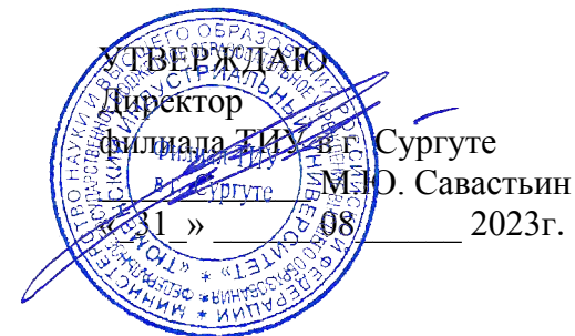
График прохождения практической подготовки в форме практики обучающимися СРЕДНЕГО ПРОФЕССИОНАЛЬНОГО ОБРАЗОВАНИЯ на 2023-2024 учебный год