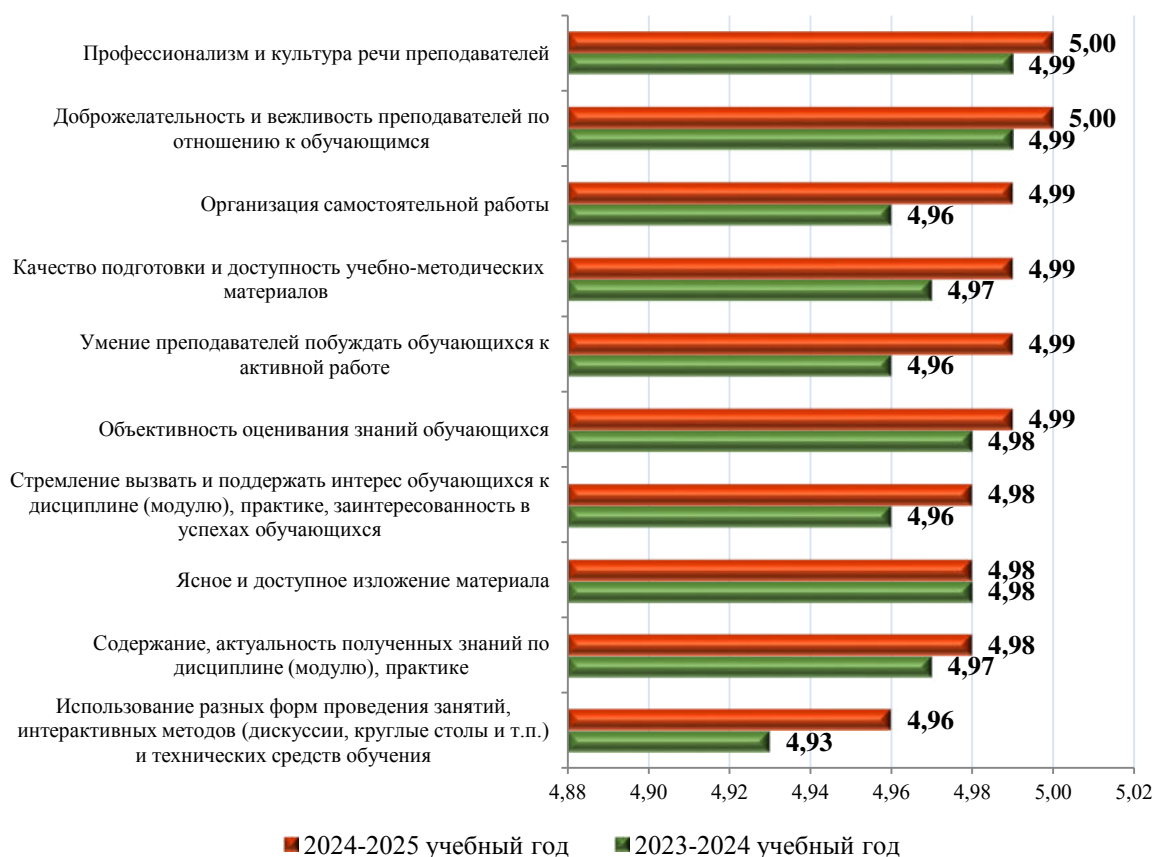
Рисунок 1 – Средние баллы по критериям, характеризующим профессиональную деятельность преподавателей ВО, входящих в рейтинг «ТОП-50» преподавателей университета, получивших самые высокие баллы

Сведения об оценках преподавателей структурных подразделений и кафедр, реализующих программы ВО, представлены в приложениях 3, 4.