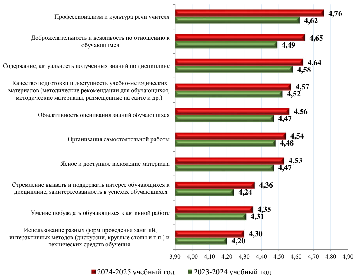
Рисунок 3 – Средние баллы по критериям, характеризующим профессиональную деятельность учителей общеобразовательного лицея по результатам 2024-2025 учебного года

Средние баллы по каждому критерию, характеризующему профессиональную деятельность учителей общеобразовательного лицея в 2024-2025 учебном году, представлены на рисунке 3.