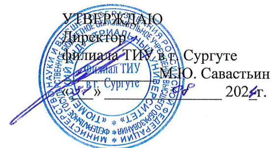
График прохождения практической подготовки в форме практики обучающимися СРЕДНЕГО ПРОФЕССИОНАЛЬНОГО ОБРАЗОВАНИЯ на 2024-2025 учебный год